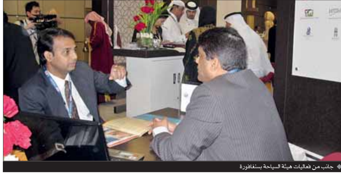
جانب من فعاليات هيئة السياحة بسنغافورة

قامت لجنة كأس آسيا برعاية حفل استقبال رائع في جناح دولة قطر يوم الخميس للترويج للبطولة التي ينتظرها كثيرون والتي ستقام في قطر في يناير 2011 وذلك بتقديم كثير من الهدايا المجانية لمراكات عالمية شهيرة، وقد عمّ حفل الاستقبال جو من الموسيقى التراثية الحية والقهوة العربية وكرم الضيافة القطري الأصلي. ثم أجري سحب على جائزة كبرى تشمل تذاكر مجانية مهددة من الخطوط الجوية القطرية، وإقامة في فنادق فاخرة فئة 5 نجوم، وجولات مجانية في قطر، وتذاكر لحضور كأس الأمم الآسيوية لكرة القدم.