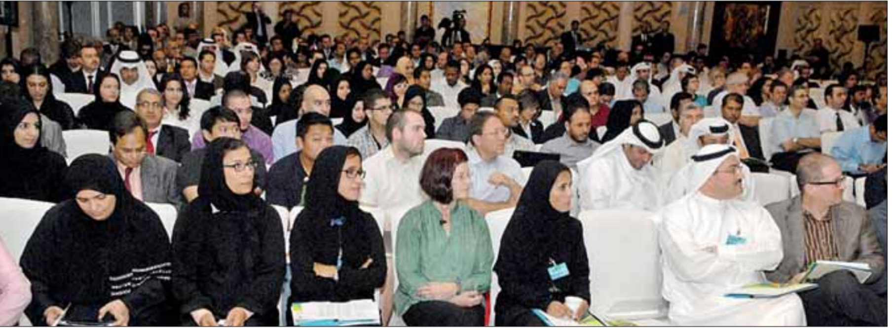
كتب طارق خباب