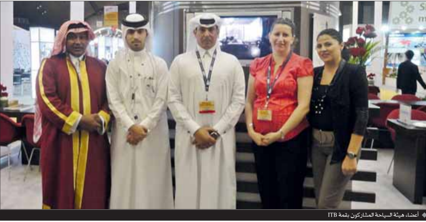
أعضاء هيئة السياحة المشاركون بقمة ITTB