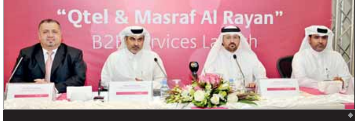
كتب - طارق خطاب