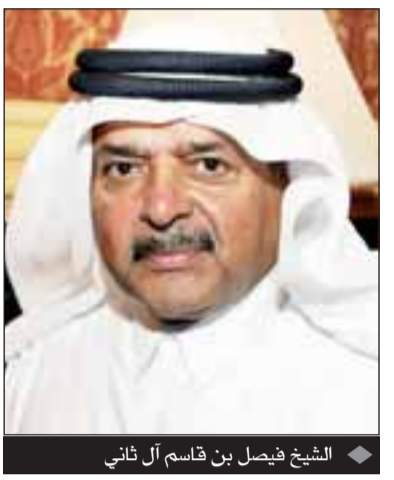
الشيخ فيصل بن قاسم آل ثاني

الاستثمارات الرأسمالية الكبيرة بدأت في إعطاء عائدات مجدية فيصل بن قاسم: نتوقع استمرار أدائها القوي في الربع الأخير مع تنوع أعمالنا