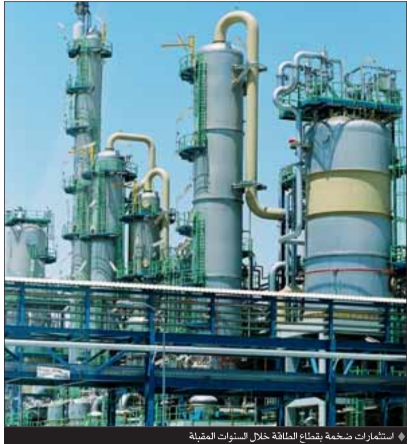
استثمارات ضخمة بقطاع الطاقة خلال السنوات المقبلة

خلال العام الماضي - بحسب تقارير دورية لوزارة التجارة الأمريكية - يزيد على 2.5 مليار دولار تتقدمها صادرات معدات النقل والكمبيوتر والالكترونيات. وقال: إن قطاع الطاقة في قطر جذب ما يعادل 100 مليار دولار استثمارات مقدرًا ما بين 60 إلى 70 مليارات من أمريكا وتابع.. من المقدر ان تستثمر قطر ما يعادل 120 مليار دولار بقطاع الطاقة خلال السنوات الـ 10 القادمة. وقال: إن قطر تشهد طفرة غير مسبوقة متوقعا ان تستثمر 60 مليار دولار في بناء وتطوير البنية التحتية والمقارنات اضافة الى القطاع الطبي والمشروعات الصحية مشيرا الى ان ذلك يؤدي الى اهتمام كبير من رجال الاعمال بالولايات المتحدة وخاصة ولاية تكساس والمشروعات في قطر. وشدد على أنه رغم التقدم المطرد والطفرة الهائلة غير أن الهوية القطرية لم تذب.